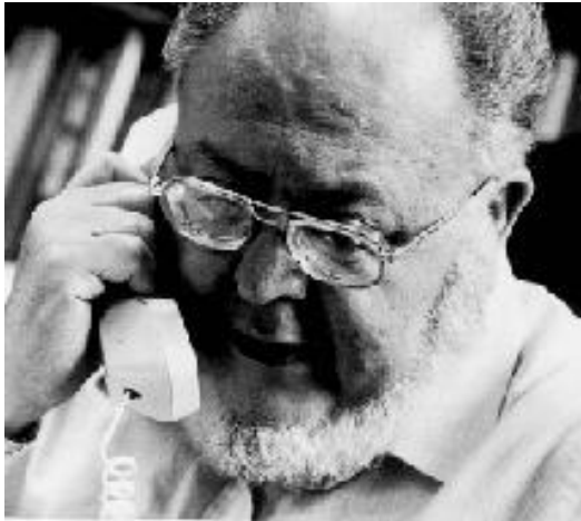
Hermann Kahn (1922-83), amerik. Kybernetiker u. Futurologe

„Aus der Vergangenheit kann jeder lernen. Heute kommt es darauf an, aus der Zukunft zu lernen.“